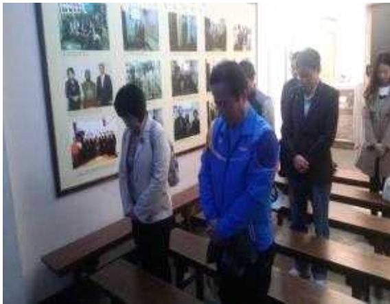
【애국지사에 대한 묵념】