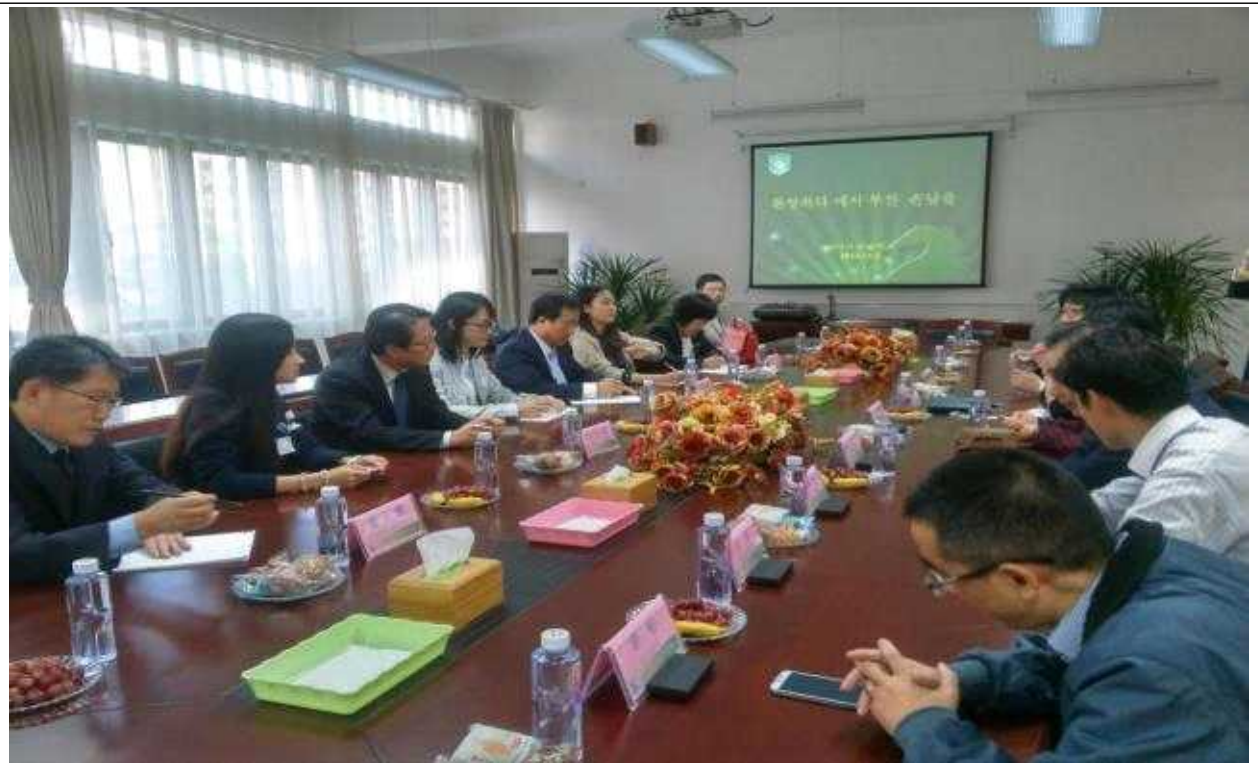
【후이셴중학교 학교현황 브리핑장면】