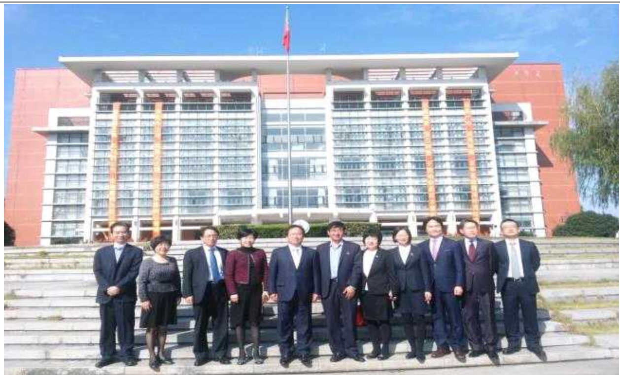
【평원중학교 관계자와 기념촬영】