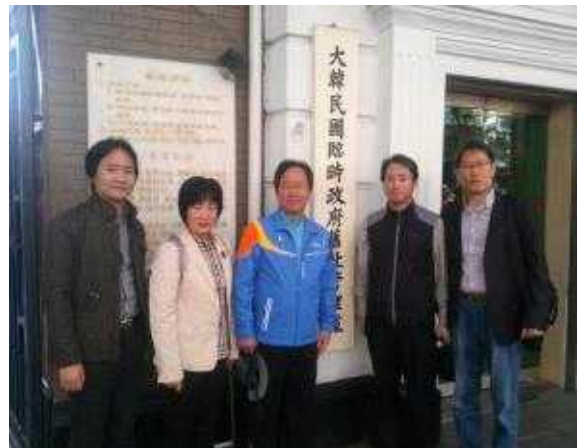
【청사 앞 기념촬영】