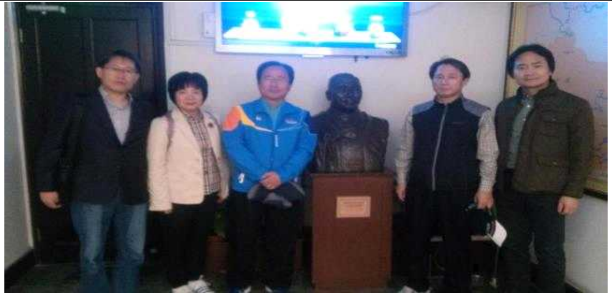
【대한민국 상해 임시정부청사 김구선생 흉상 앞 기념촬영】