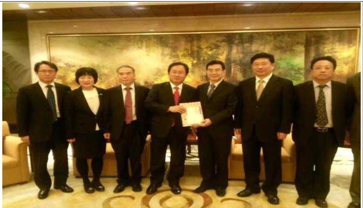
【상해교육위원회 관계자들과 선물교환】