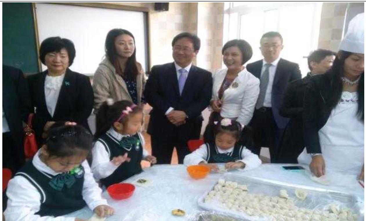
【교사연수학원 부속 실험초등학교 학생실습 시찰장면】