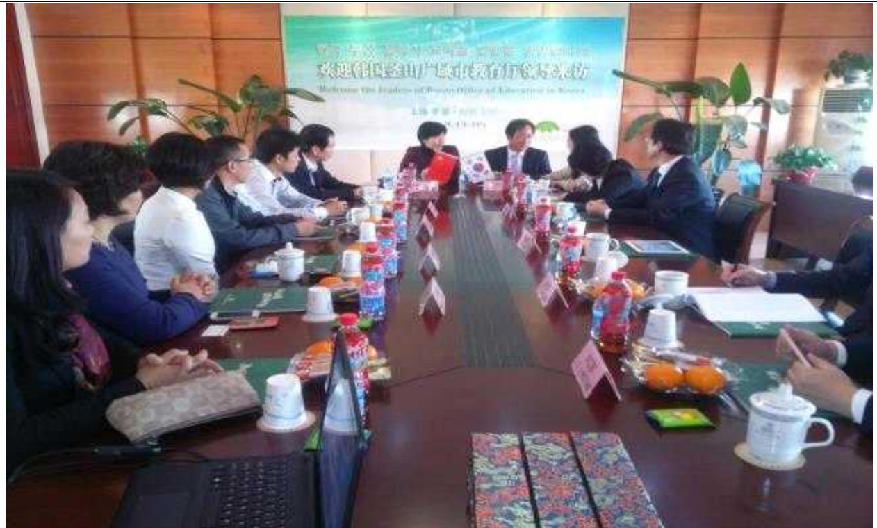
【교사연수학원 부속 실험초등학교 협의회 장면】