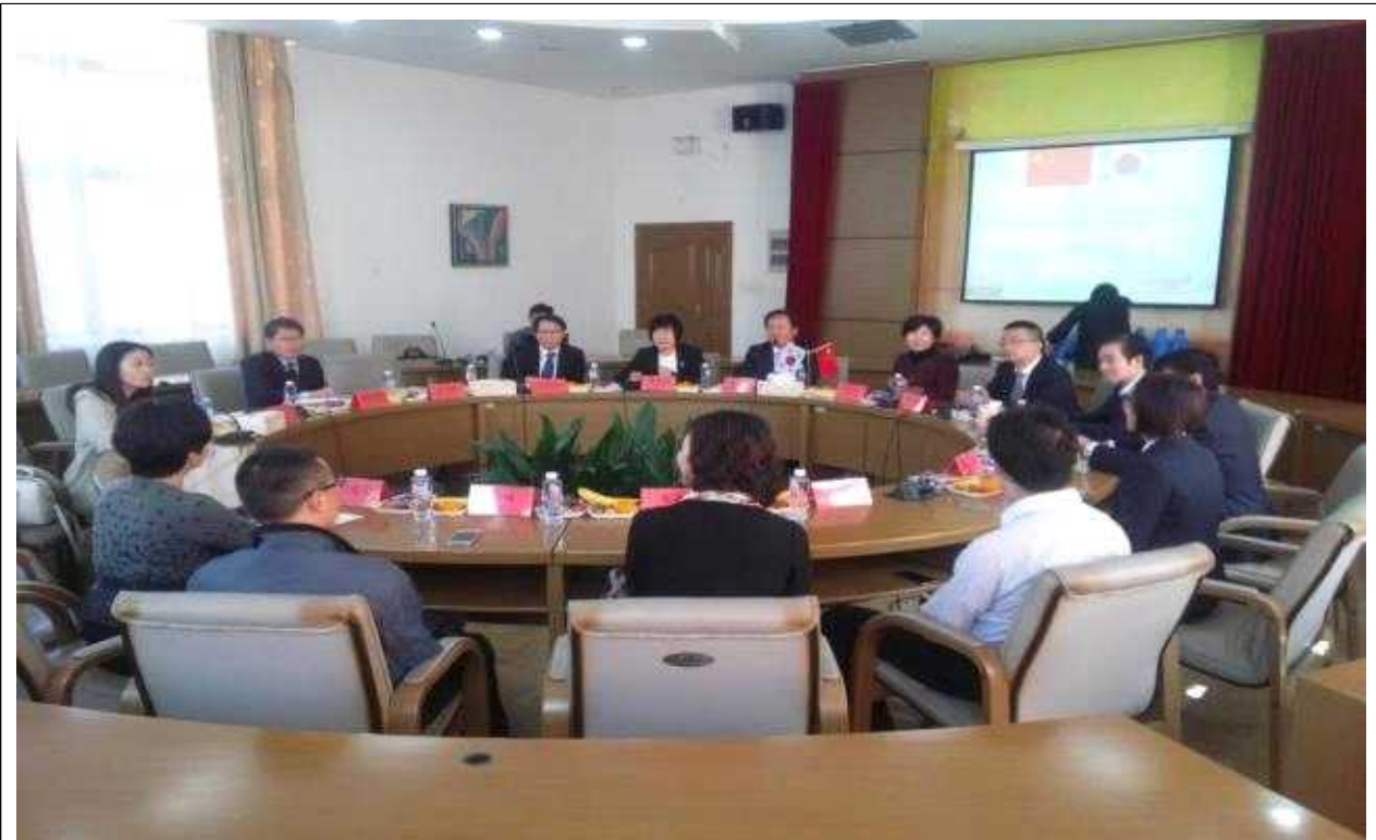
【평선중학교 관계자와 협의장면】