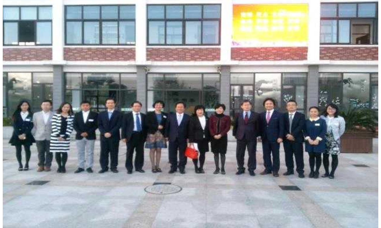
【 후이셴중학교 기념촬영 】