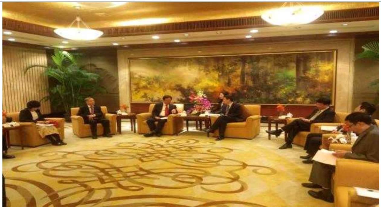
【상해교육위원회 관계자와의 상호 토론장면】