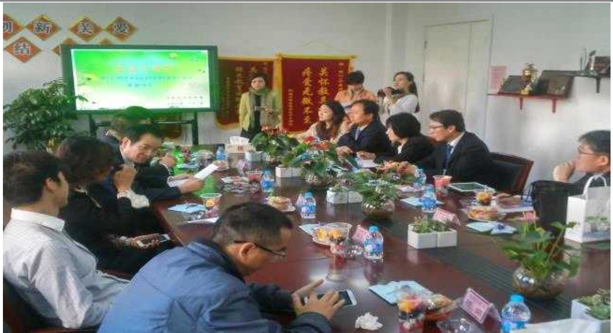
【녹엽유치원 관계자들과 협의장면】