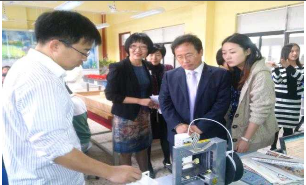
【 후이셴중학교 실험실습실 시찰장면 】