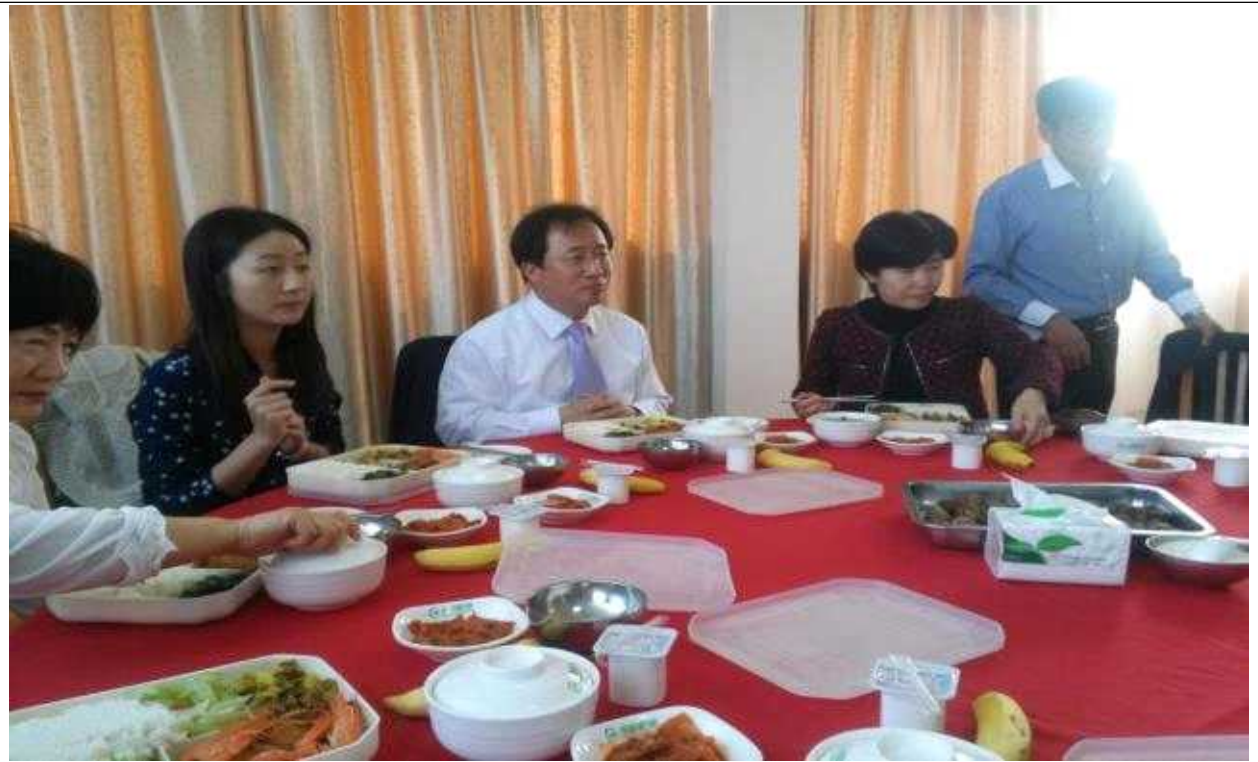
【평원중학교 학교식당에서 중식장면】