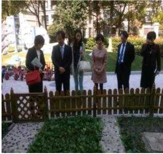
【녹엽유치원 텃밭 시찰장면】