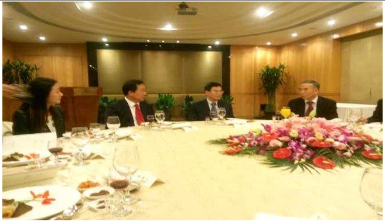
【상해교육위원회 관계자들과 업무협의 및 만찬】