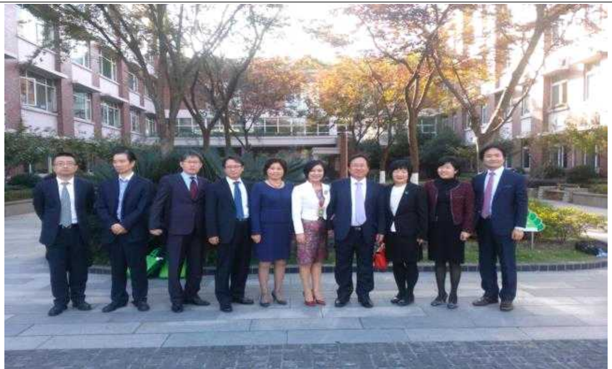
【교사연수학원 부속 실험초등학교 기념촬영】