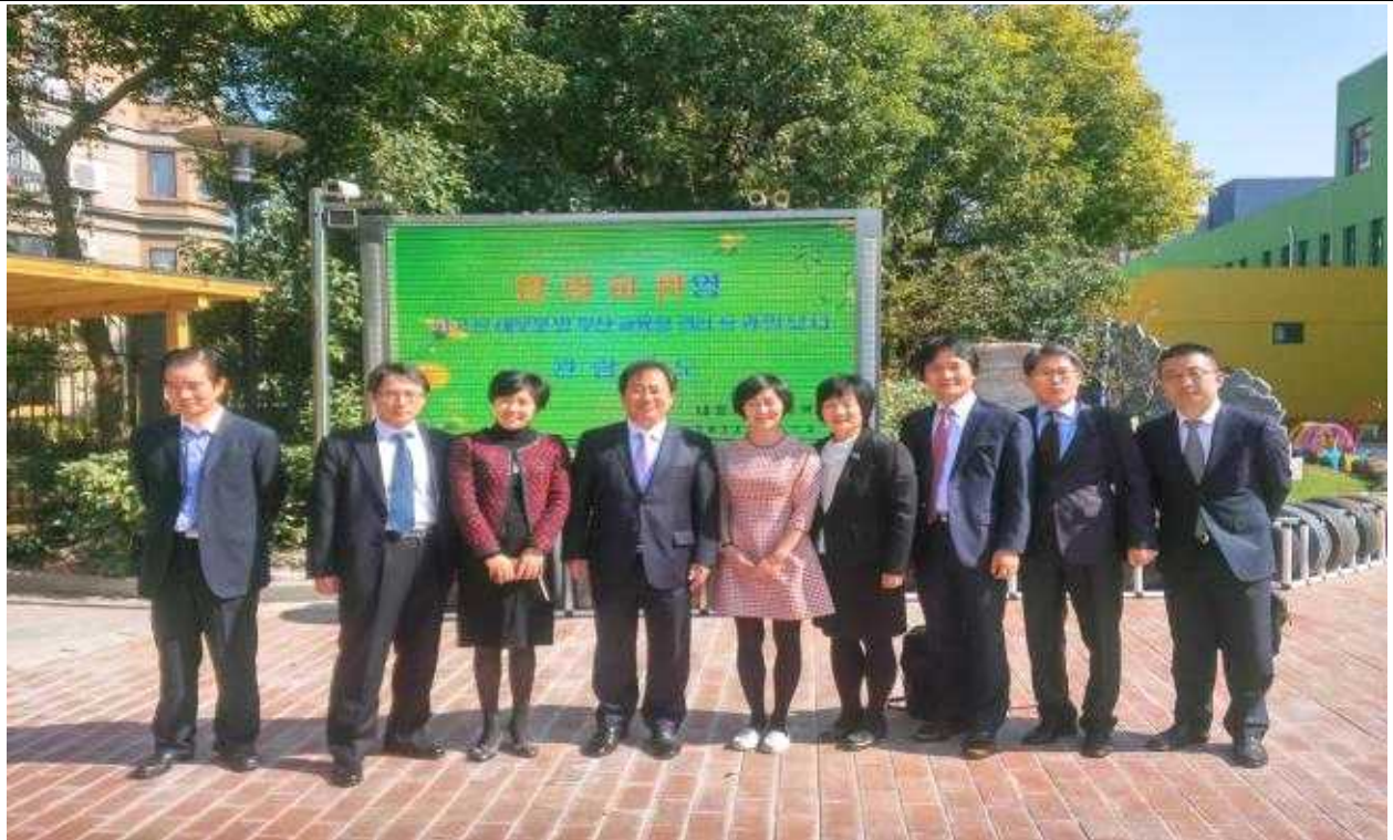
【부산시교육감 환영 현황관 앞에서 기념촬영】