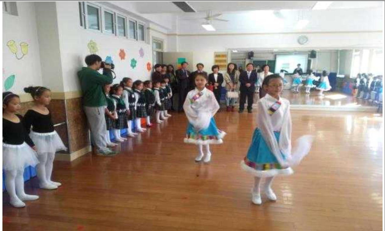
【교사연수학원 부속 실험초등학교 무용실습 시찰장면】