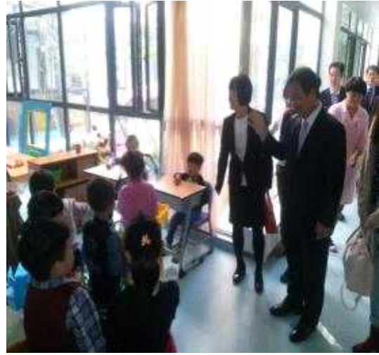
【녹엽유치원 수업 참관장면】