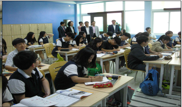
호치민시 한국국제학교 수업참관