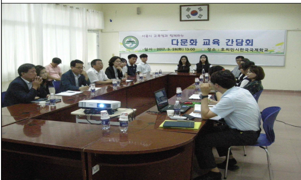
다문화 교육 간담회