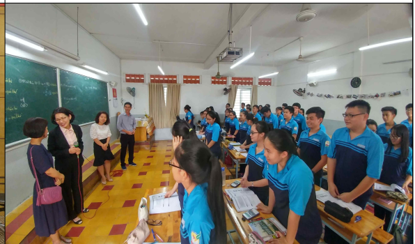
부이티쑤언고등학교 한국어 수업참관