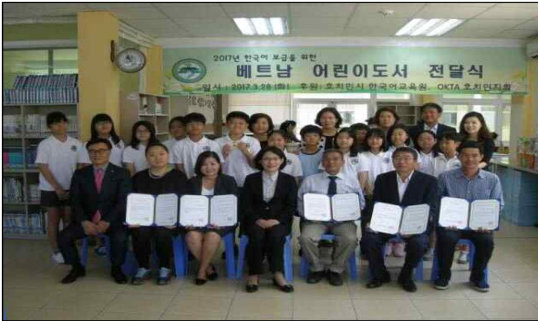
호치민시 한국국제학교 도서전달식